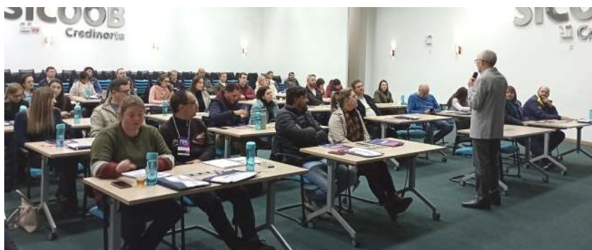
Turma 8 no 3º módulo do PGVE