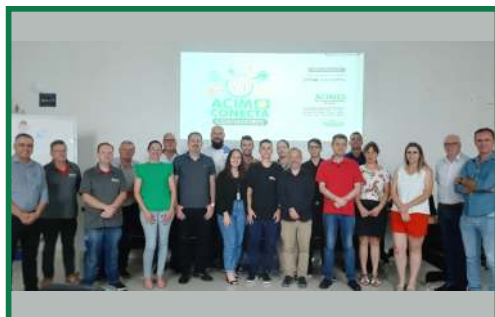
ACIM Conecta - Contadores