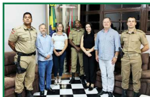
Visita em conjunto da ACIM, Facisc e ACI de Itaiópolis ao comando da PM de Mafra sobre segurança pública