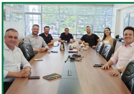
Visita da diretoria do CEJESC, conhecendo o núcleo de Jovens Empreendedores da ACIM