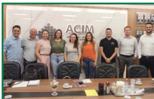
Primeiro workshop de coordenadores de núcleos ACIM