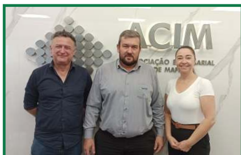
Visita do Gerente da Agencia de atendimento do SEBRA/SC