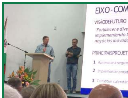
ACIM presente no PEDEM