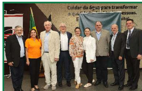
Recepção da comitiva da Câmara de Artes e Ofícios de Munique e Alta Baviera (HWK) em celebração aos 30 anos da Fundação Empreender