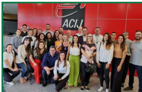
Participação da oficina de projetos junto ao PAN SC e CACB na ACIJ em Joinville